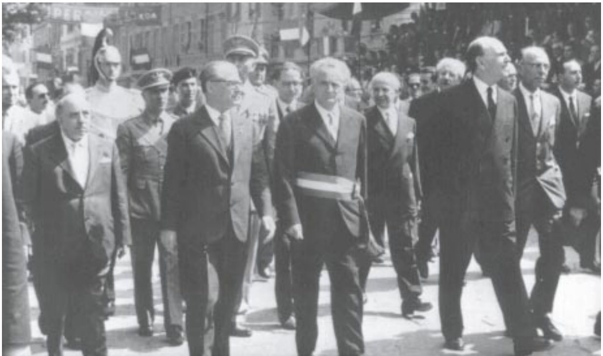
Giugno 1956. Inaugurazione del Monumento al partigiano. Il sindaco Ferrari con Giovanni Gronchi, presidente della Repubblica

In generale, la gestione di Ferrari cerca di sostenere, in modo più o meno diretto, tutti gli enti, le istituzioni o le persone che operano nel sociale: eroga, infatti, contributi ad asili, scuole e a parecchi enti assistenziali. Grande attenzione viene dedicata agli anziani, ricoverati presso l'Istituto "Mario Romanini", ai cui lavori di miglioramento e di estensione l'amministrazione partecipa con grande attenzione e con numerosi contributi. Consistente è infatti l'elargizione per costruire un nuovo pensionato e una moderna infermeria, e l'intero fabbricato dell'ex Preventorio comunale col parco viene destinato ad ospitare la nuova "Casa di riposo M. Romanini". Anche la rete