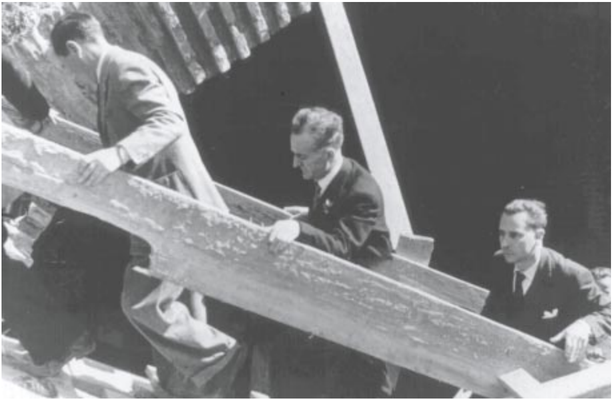
Maggio 1947 (terzo governo De Gasperi). Il ministro Ferrari visita il cantiere per la costruzione del ponte-ferrovia di Pontecchio Marconi, nella linea Bologna-Firenze

Rimane alla Costituente fino alla conclusione dei lavori: il 1° gennaio 1948 era entrata in vigore la nuova carta costituzionale. In seguito, nel partito, verrà nominato presidente della Commissione centrale di controllo, incarico che ricoprirà per