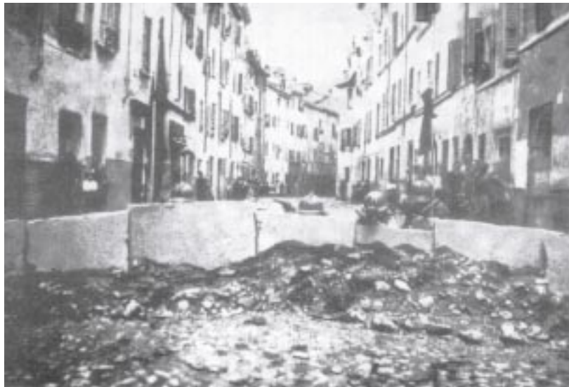
La trincea di via XX Settembre durante le barricate parmigiane del 1922